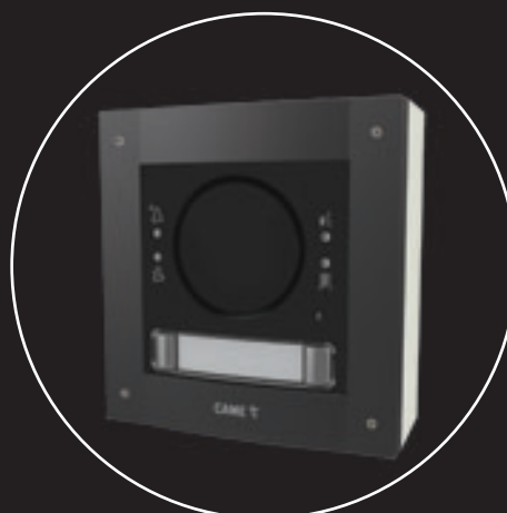
WERSJA WANDALOODPORNĄ - CERTYFIKAT IK09