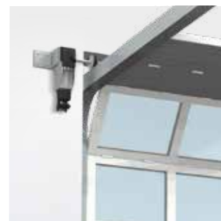
Toepassing op Sectionaalpoorten