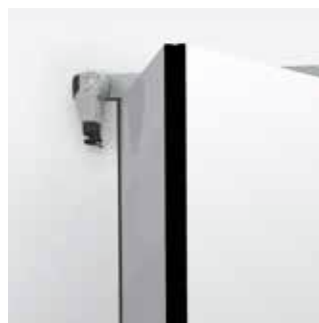
Toepassing op vouwschuifdeuren