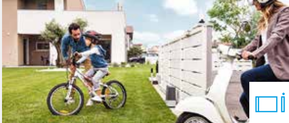
AUTOMATISERINGEN VOOR SCHUIFHEKKEN