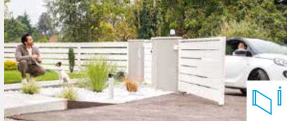
AUTOMATISERINGEN VOOR DRAAIHEKKEN