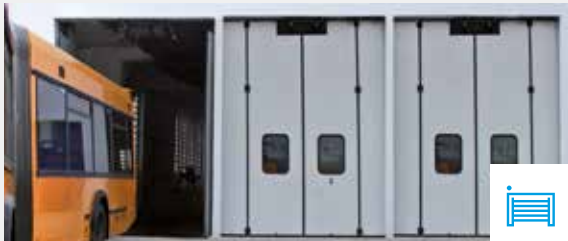
AUTOMATISERINGEN VOOR INDUSTRIËLE AFSLUITINGEN