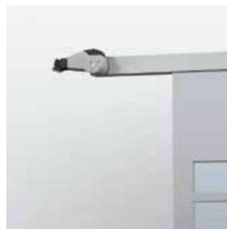
Toepassing op schuifdeuren