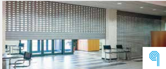
AUTOMATISERINGEN VOOR ROLLUIKEN